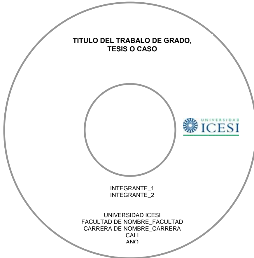
Imagen 1. Carátula