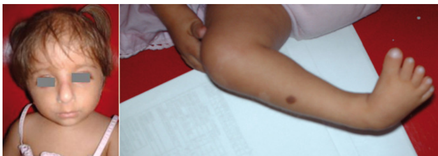
Figura 3. Vista general de paciente 2 con facies típicas de síndrome de Seckel y pie equino varo derecho.