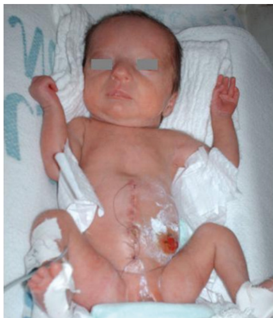
Figura 5. Se evidencia paciente 1 con características fenotípicas de síndrome de Seckel, además se encuentra herida quirúrgica postoperatoria por atresia a nivel del íleon terminal.

hacia abajo, nariz prominente, paladar ojival, micrognatia, frente prominente, clinodactilia bilateral y distensión abdominal (figura 5), además en la radiografía puede observarse una hipoplasia de fémur izquierdo. Se solicitó eco abdominal que evidencia gran quiste meconial, por lo que es llevada a cirugía donde se encontró atresia a nivel del íleon terminal.