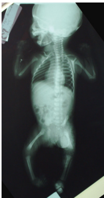
Figura 4. Radiografía de paciente 2, donde se aprecia 11 costillas y pie equino varo.