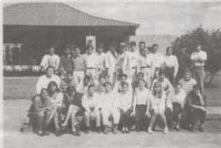
SEMINARIO PARA ESTUDIANTES UNIVERSITARIOS

funcionamiento de entidades que apoyan la creación de empresas como el caso de Fundaempresa. Adicionalmente participaron en dos talleres prácticos: uno sobre Liderazgo y otro sobre Creatividad.