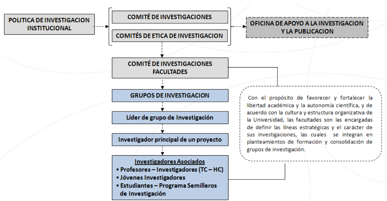
Gráfica No. 1 Estructura del Sistema de Investigación – Universidad Icesi.