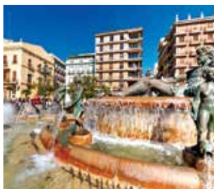
Universidad de Valencia (Valencia, España)