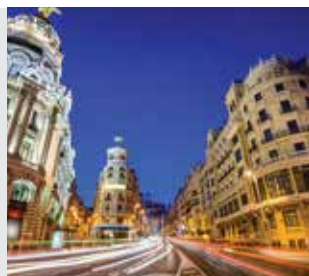
Universidad Carlos III (Madrid, España)