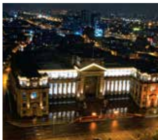
Universidad ESAN (Lima, Perú)

Algunas de las universidades con las que tenemos convenio para estos cursos son las siguientes: