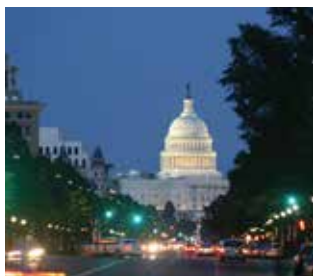
George Mason University (Washington, Estados Unidos)