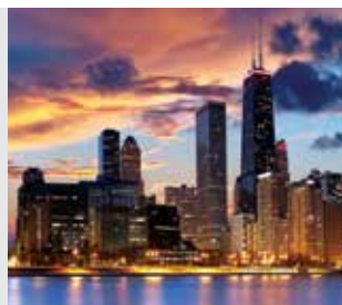
Illinois Institute of Technology (Chicago, Estados Unidos)