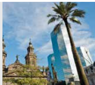
Universidad de Chile (Santiago de Chile, Chile)