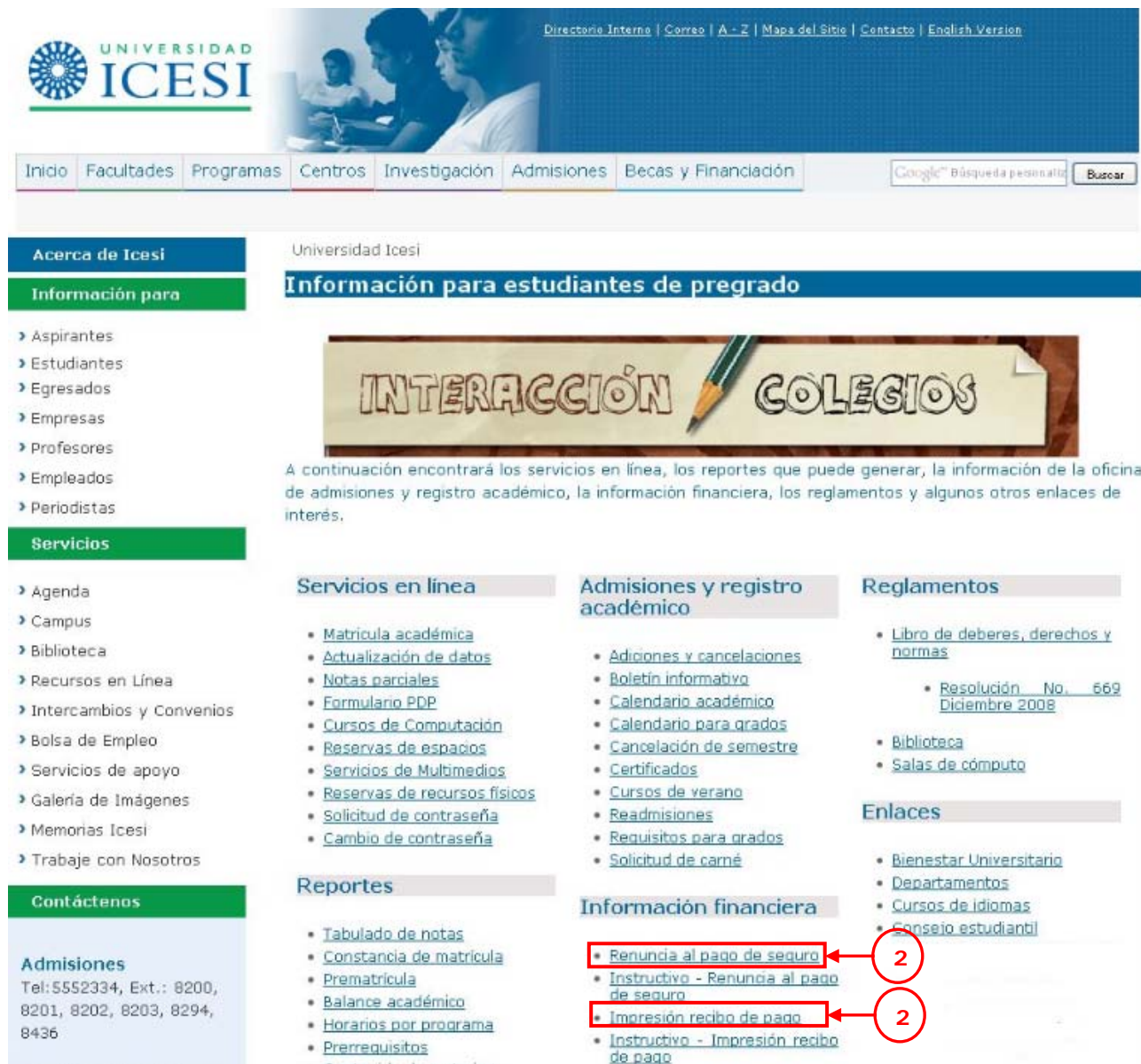
Imagen 2. Renuncia al pago del seguro

Al hacer clic en Renuncia al pago de seguro , aparecerá una ventana de inicio de sesión. Digite el número de su documento de identidad, numeral 3 de la imagen 3 , y su contraseña única, numeral 4 de la imagen 3 (ver imagen 3).