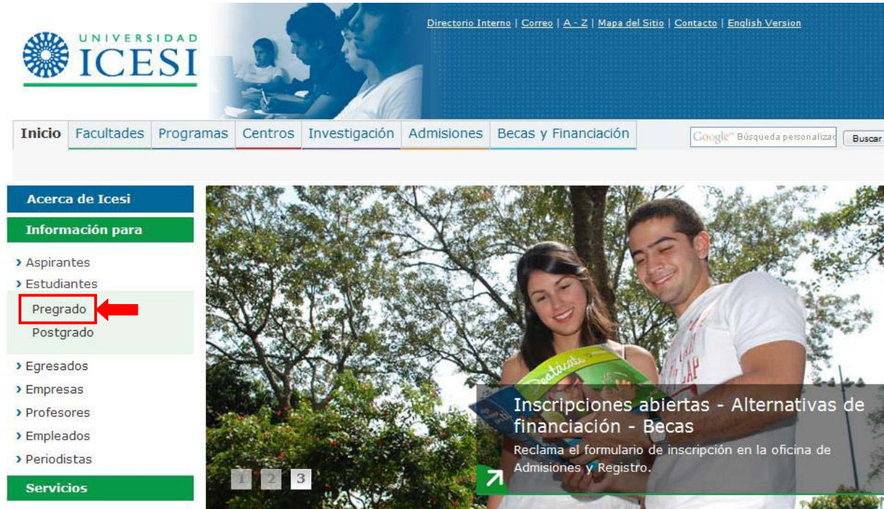
Imagen 1. Ingreso al portal de estudiantes

Para ingresar a la aplicación que permite la renuncia del pago de seguro: ingrese a www.icesi.edu.co , en el portal de estudiantes; debe elegir “Pregrado” (ver imagen 1).