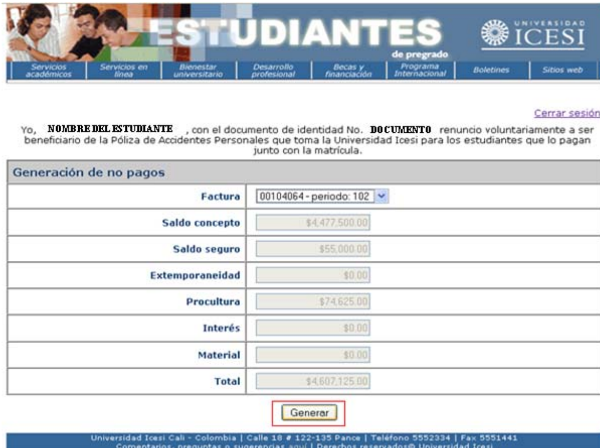
Imagen 5. Botón "Generar" activo

De esta manera se activará el botón Generar . Haga clic en el botón generar para la renuncia del pago del seguro (ver imagen 5).