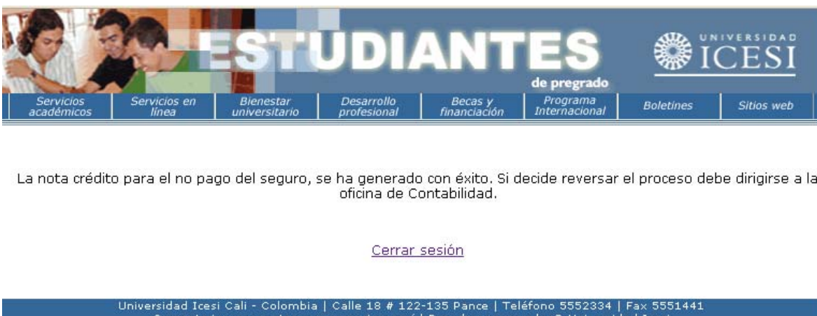
Imagen 6. Mensaje exitoso de la nota crédito generada

Si el proceso ha sido exitoso, aparecerá un mensaje de confirmación (ver imagen 6), de lo contrario, por favor informarlo a soporte-syri@listas.icesi.edu.co.