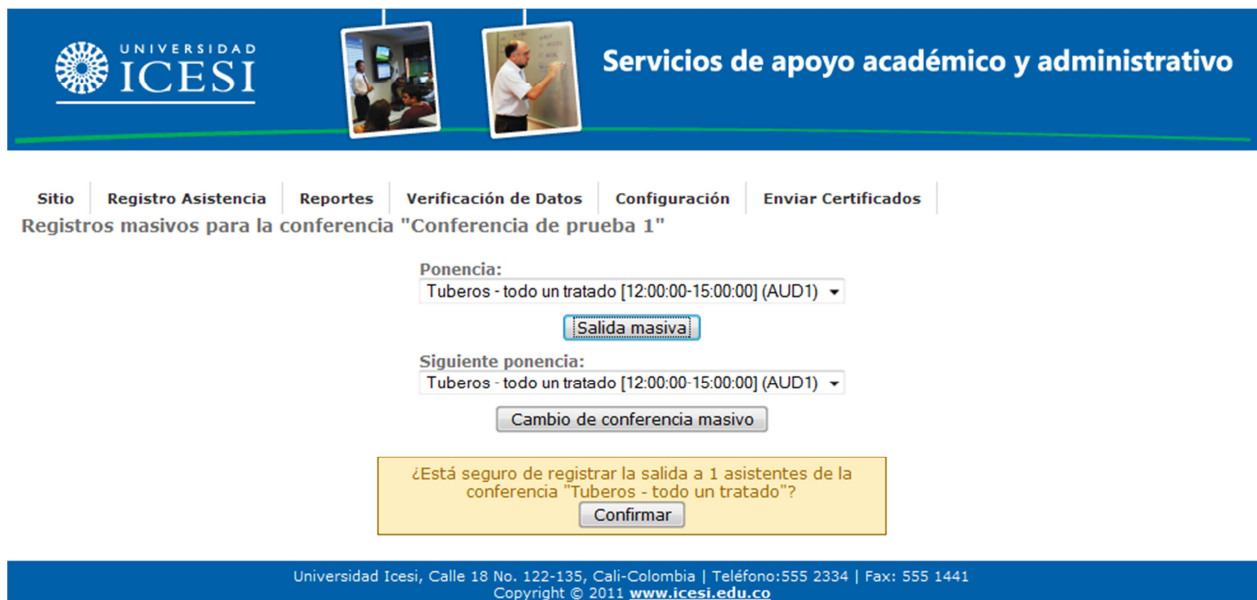
Figura 6. Registro de asistencia masivo con mensaje de confirmación de salida masiva

Un cambio masivo consiste en registrar la salida masiva de la ponencia seleccionada en el campo "Ponencia" y posteriormente registrar la entrada a todos los asistentes en la ponencia seleccionada en el campo "Siguiete ponencia".