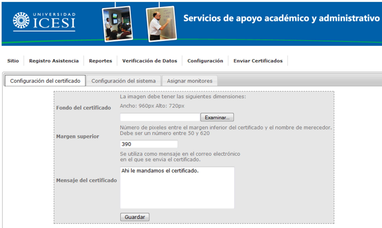
Figura 12. Configuración del certificado

Esta opción permite configurar el aspecto visual del certificado que será enviado a los usuarios una vez haya concluido el evento. Dentro de las opciones que se pueden configurar están: