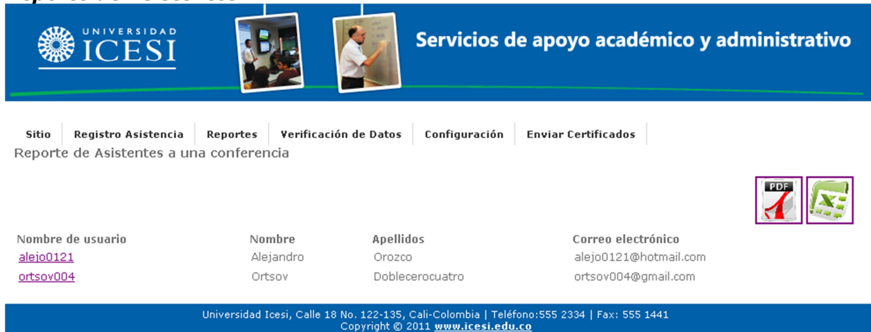
Figura 7. Reporte de asistentes

El reporte de asistentes lista a todos aquellos usuarios de OCS que además de estar inscritos en el evento tienen registrada al menos una entrada a una de las presentaciones de dicho evento.