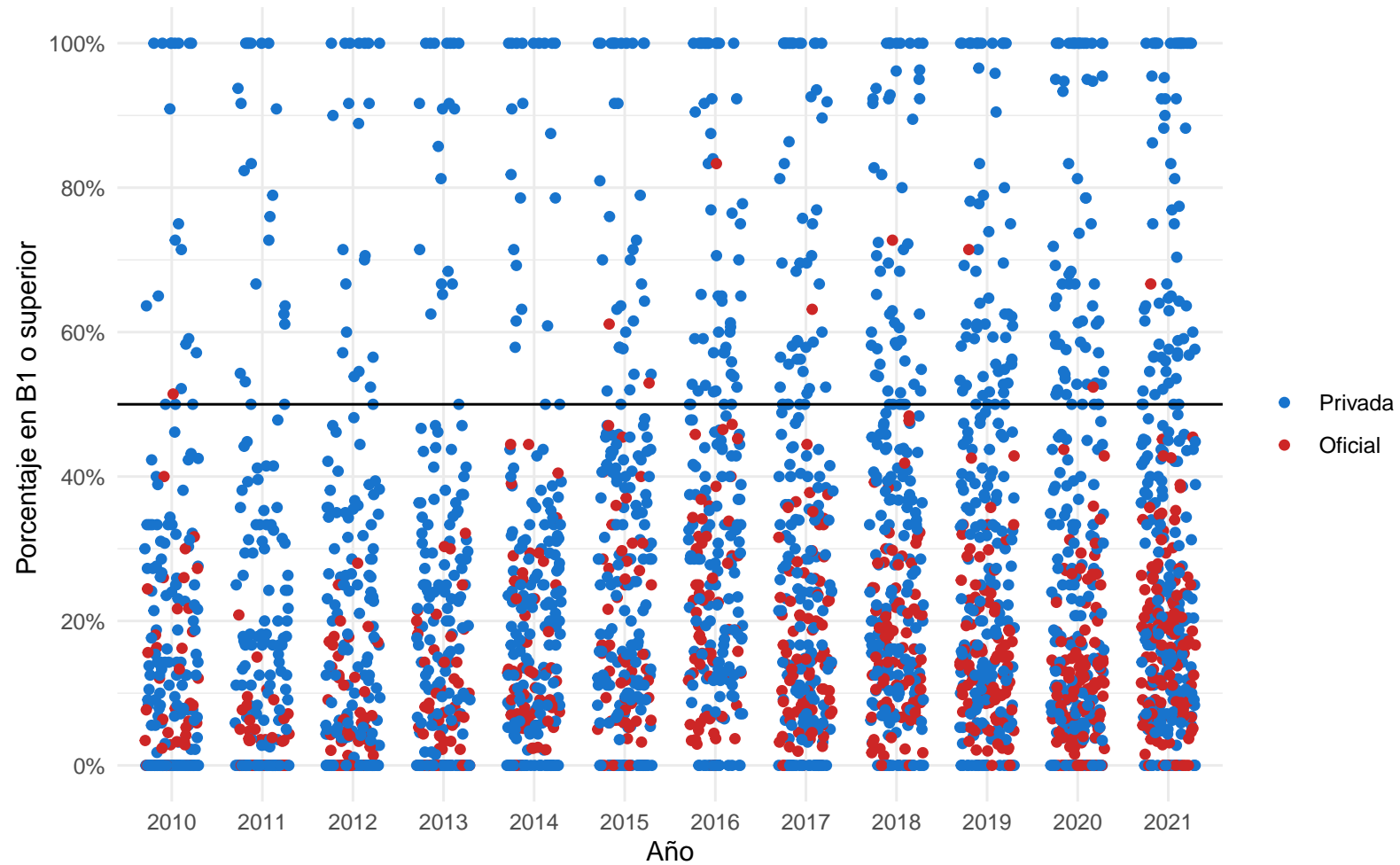
Figura 1: proporción de estudiantes clasificados igual o por encima del nivel B1 para los años 2010-2021 de acuerdo con la naturaleza de la institución educativa.

Fuente: Cálculos propios a partir de información del ICFES.