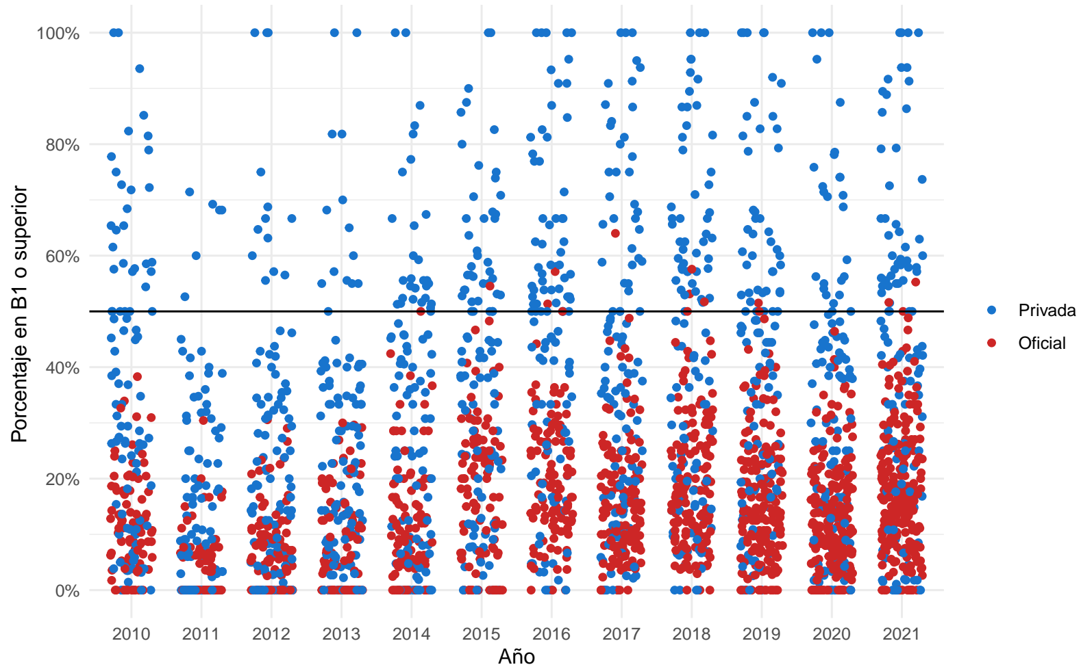
Figura 1: proporción de estudiantes clasificados igual o por encima del nivel B1 para los años 2010-2021 de acuerdo con la naturaleza de la institución educativa.

Fuente: Cálculos propios a partir de información del ICFES.