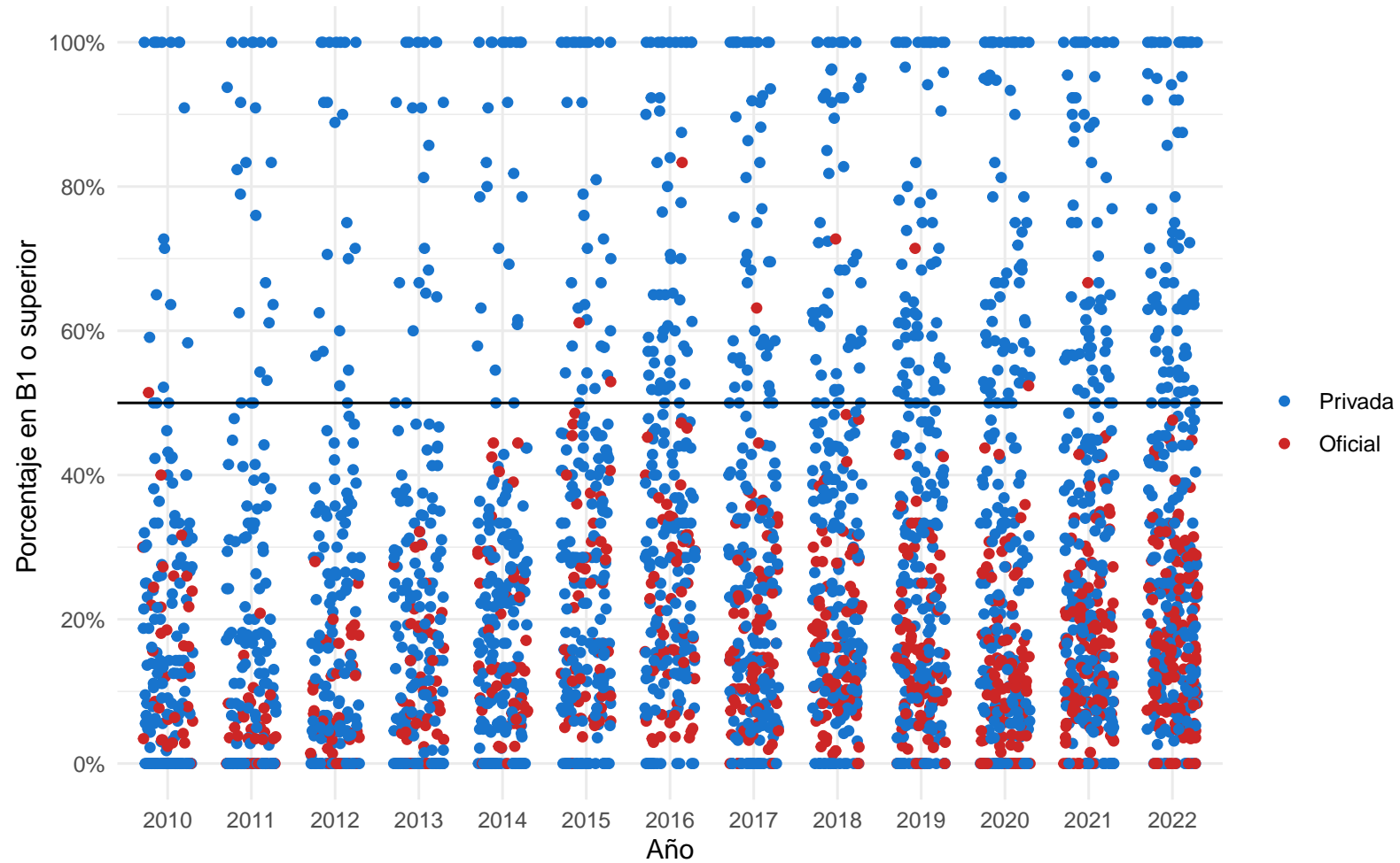
Figura 1: proporción de estudiantes clasificados igual o por encima del nivel B1 para los años 2010-2022 de acuerdo con la naturaleza de la institución educativa.

Fuente: Cálculos propios a partir de información del ICFES.