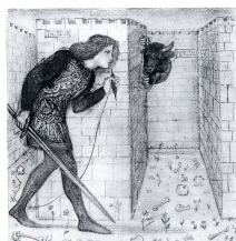
Teseo y el Minotauro.

poderosa. (A veces me duermo realmente, a veces ha cambiado el color del día cuando he abierto los ojos.) Pero de tantos juegos el que prefiero es el del otro Asterión. Finjo que viene a visitarme y que yo le muestro la casa. Con grandes reverencias le digo: Ahora volvemos a la encrucijada anterior o Ahora desembocamos en otro patio o Bien decía yo que te gustaría la canaleta o Ahora verás una cisterna que se llenó de arena o Ya verás cómo el sótano se bifurca . A veces me equivoco y nos reímos buenamente los dos.