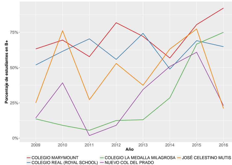
Figura 2: Evolución de desempeño en nivel de inglés B+ de los primeros cinco colegios.