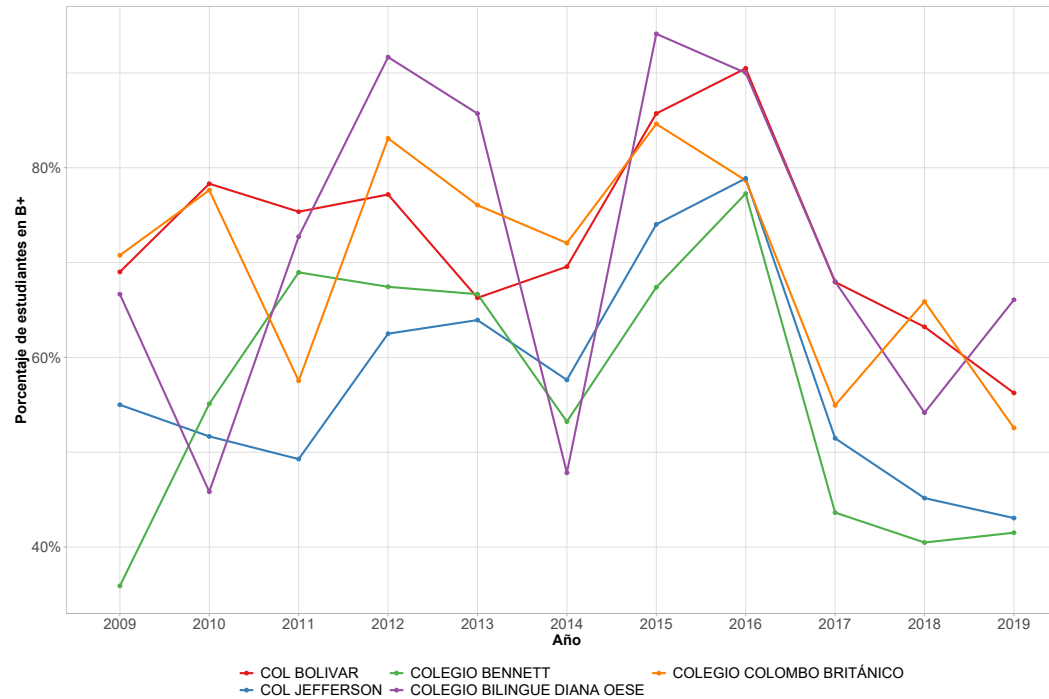
Figura 2: Evolución de desempeño en nivel de inglés B+ de los primeros cinco colegios.