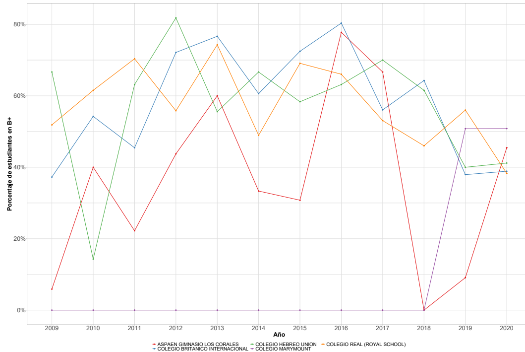
Figura 2: Evolución de desempeño en nivel de inglés B+ de los primeros cinco colegios.