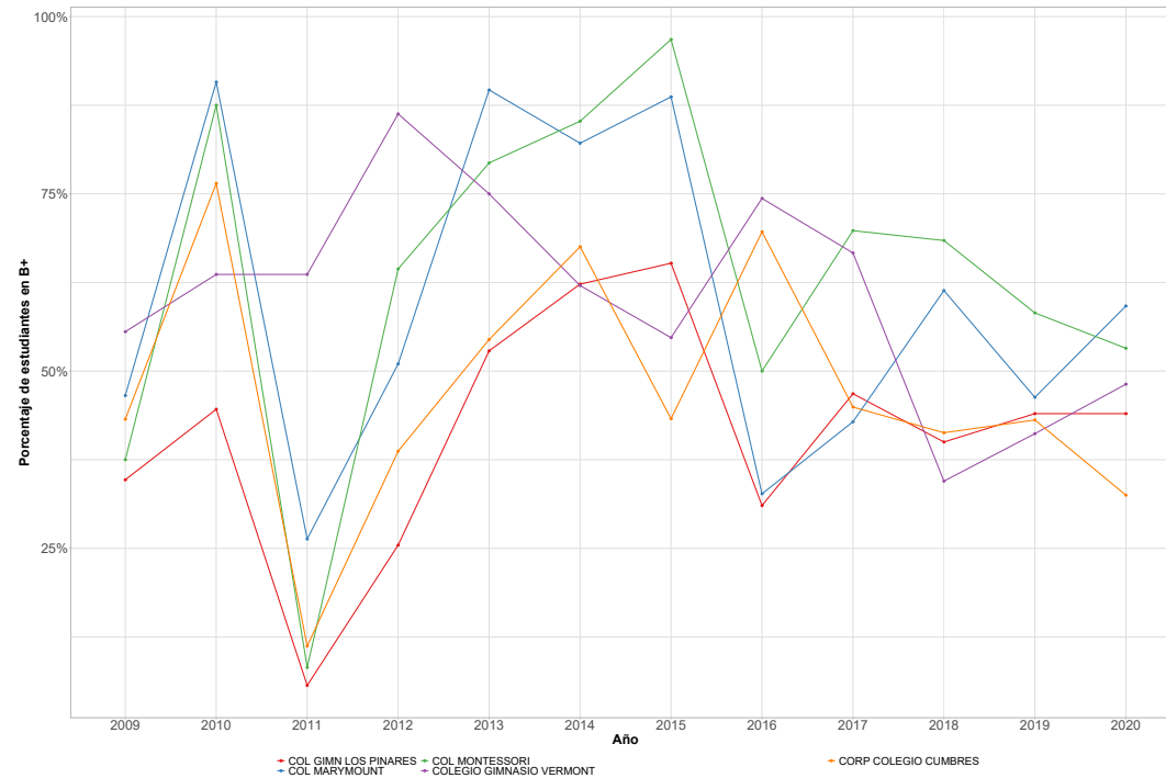
Figura 2: Evolución de desempeño en nivel de inglés B+ de los primeros cinco colegios.