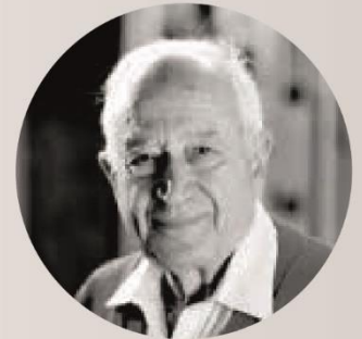
Ph.D. Raphael Mechoulam Universidad Hebrea de Jerusalén Israel