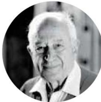
Ph.D. Raphael Mechoulam Universidad Hebrea de Jerusalén Israel Israel