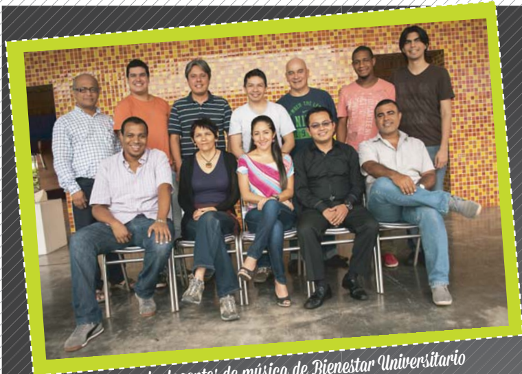
Grupo de docentes de música de Bienestar Universitario