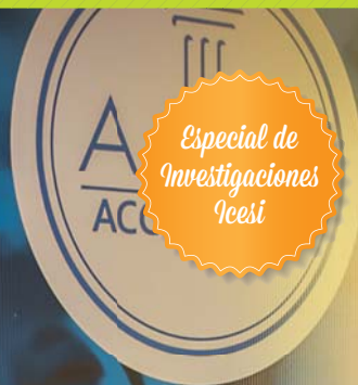
Beatriz Gallo Córdoba