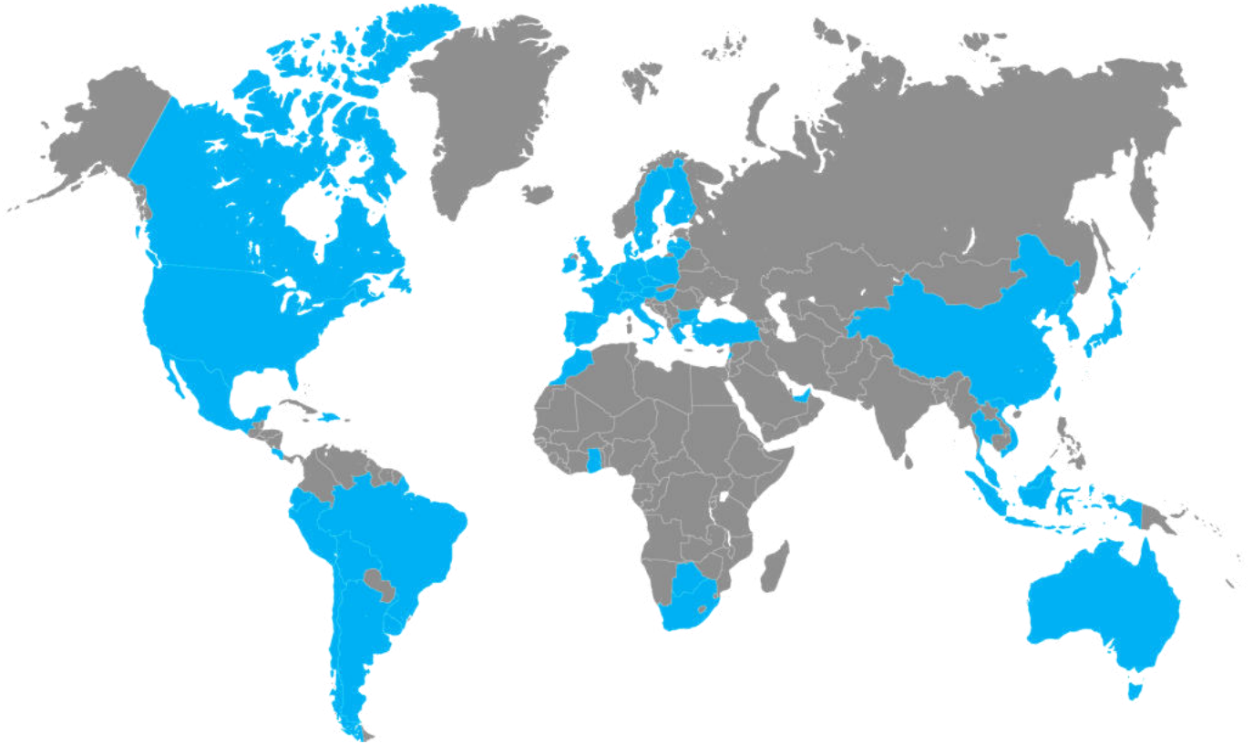
Imagen 6.2 Apertura de nuevos destinos de movilidad 2022