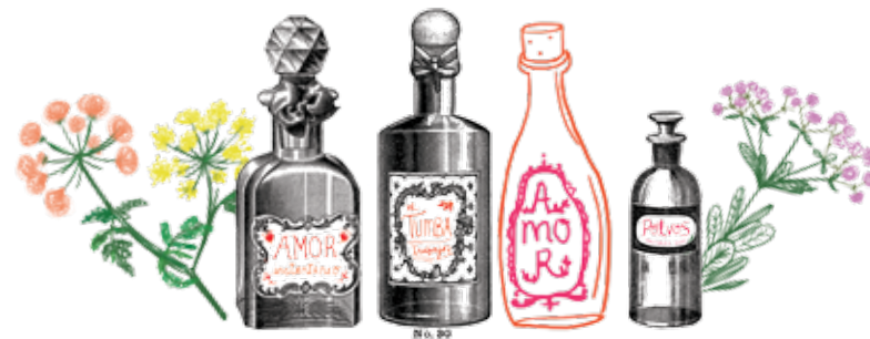
Ilustración y tipografía: Natalia Ayala Pacini

Es mujer, brasilera. Estudiante de antropología, por pasión; estudiante de derecho, por cosas de la vida. En el brazo lleva una cometa que la hace volar. Lady Gaga es su cantante favorita y adora escribir sobre las cotidianidades del mundo.