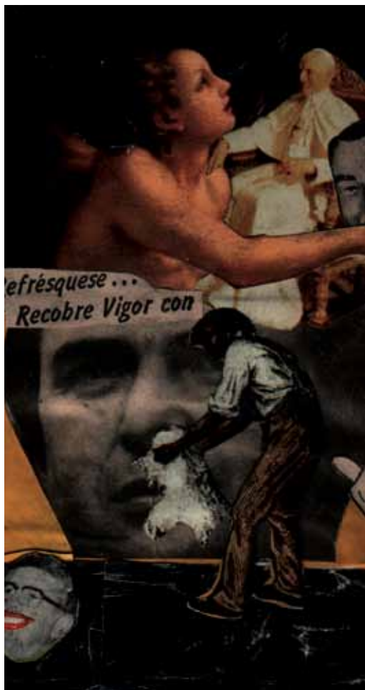
La coca de los Santos por Pedro Manrique Figueroa

anarquista. Pero treinta años después la película ha sido reconocida precisamente porque el tema de la pornomiseria es un tema que sigue vigente. Aquí y en toda Latinoamérica se sigue filmando la miseria y se sigue explotando el tema de la pobreza. Y lo otro es la cuestión formal de la película, que es una de las primeras que se plantea como un falso documental. Yo no tengo conocimiento de películas que en ese momento se hayan planteado ese cruce entre la ficción y el documental. Quizá alguna película como El camino hacia la muerte del viejo Reales (1968), de Gerardo Vallejo, junta esos dos elementos también. Y además que es una película sobre el cine. Precisamente porque nosotros veníamos de la crítica del cine, decidimos hacer la crítica del cine no escrita sino filmada. Ese fue un paso cualitativo que hicimos ahí.