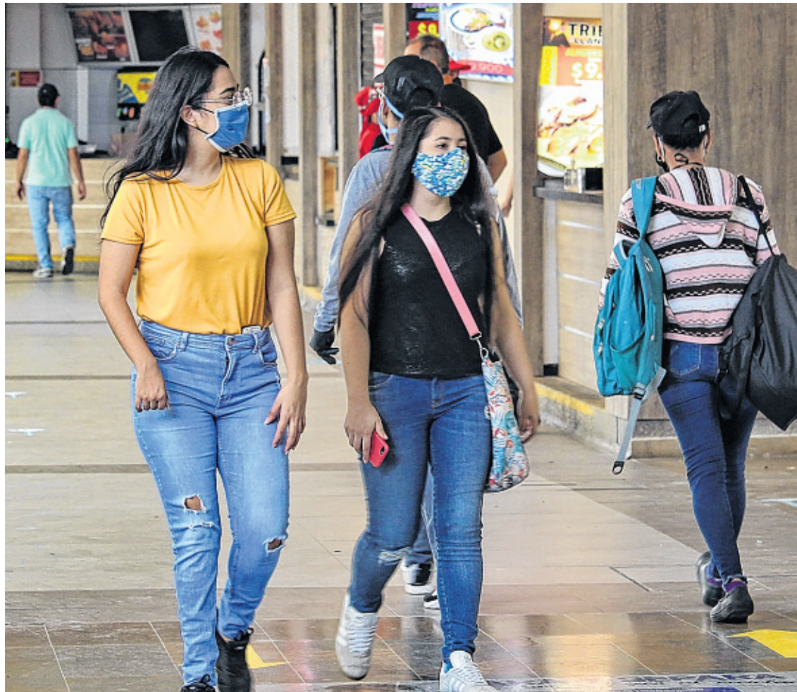
En Cali, de acuerdo con el informe de Polis, la clase media es altamente vulnerable, lo cual es revelado a través de varias dimensiones como la inestabilidad social, cobertura en educación y en la vinculación y pagos al sistema de protección social.