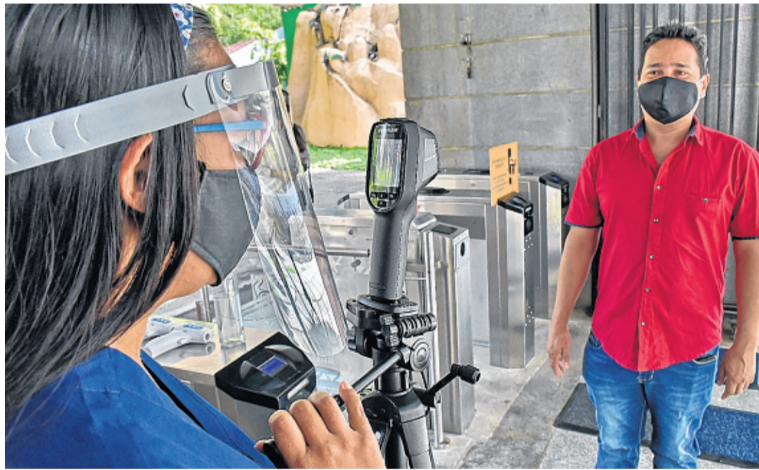
Varios sectores productivos de Cali y el Valle han firmado pactos de bioseguridad con el propósito de reactivar su producción pero teniendo en cuenta la protección de los ciudadanos.

Cada semana Polis y El País presentarán un informe con los retos que deberá afrontar Cali en la postpandemia. Presentación.