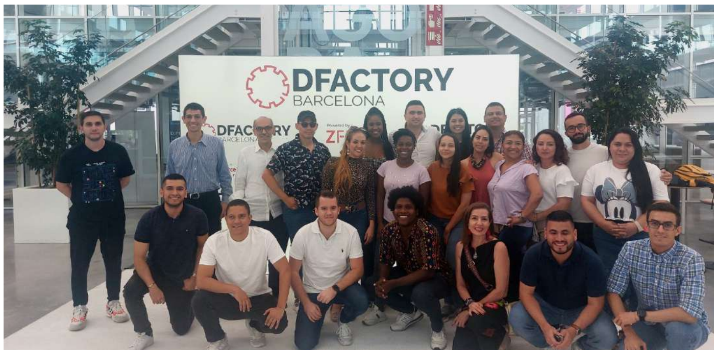
Tecnocampus BARCELONA, ESPAÑA