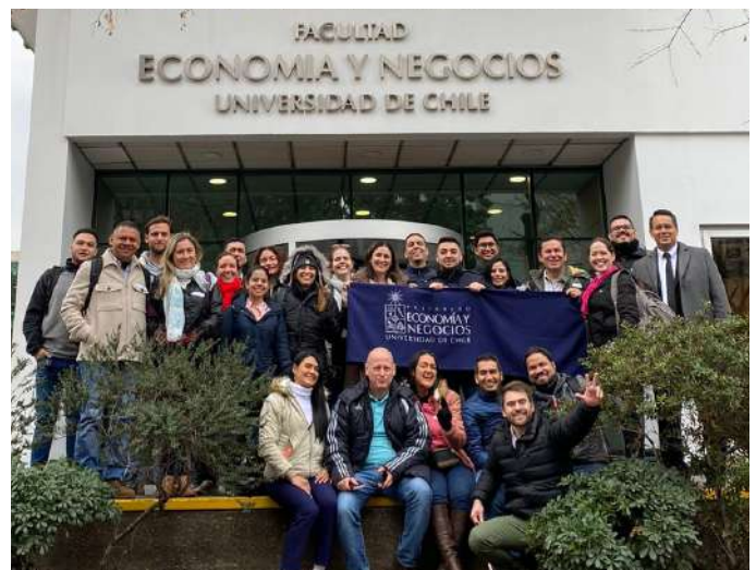
Universidad De Chile SANTIAGO DE CHILE, CHILE