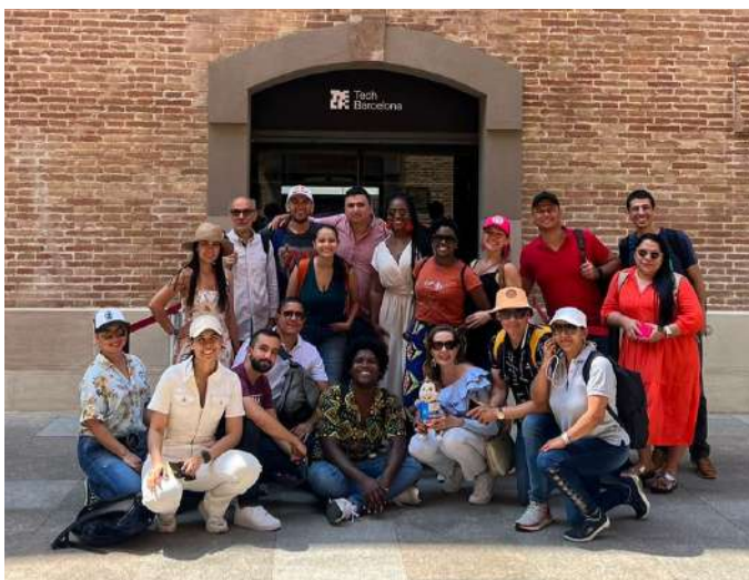
Tecnocampus BARCELONA, ESPAÑA