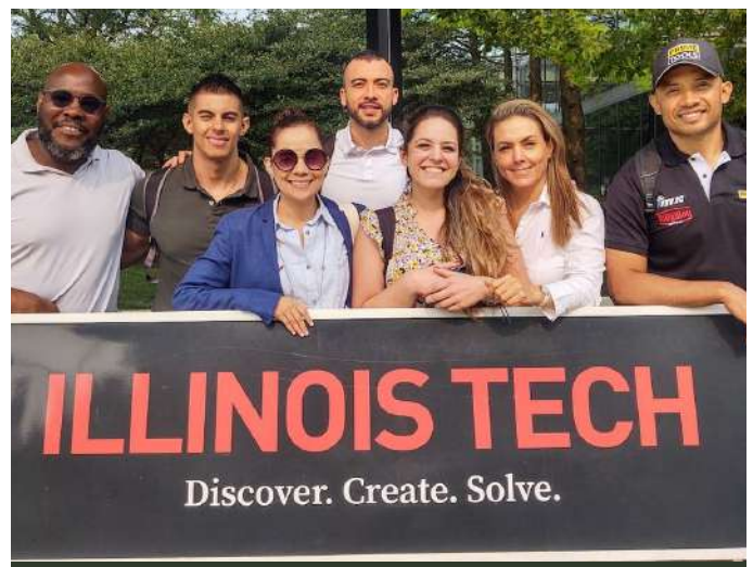
Illinois Institute of Technology CHICAGO, ESTADOS UNIDOS