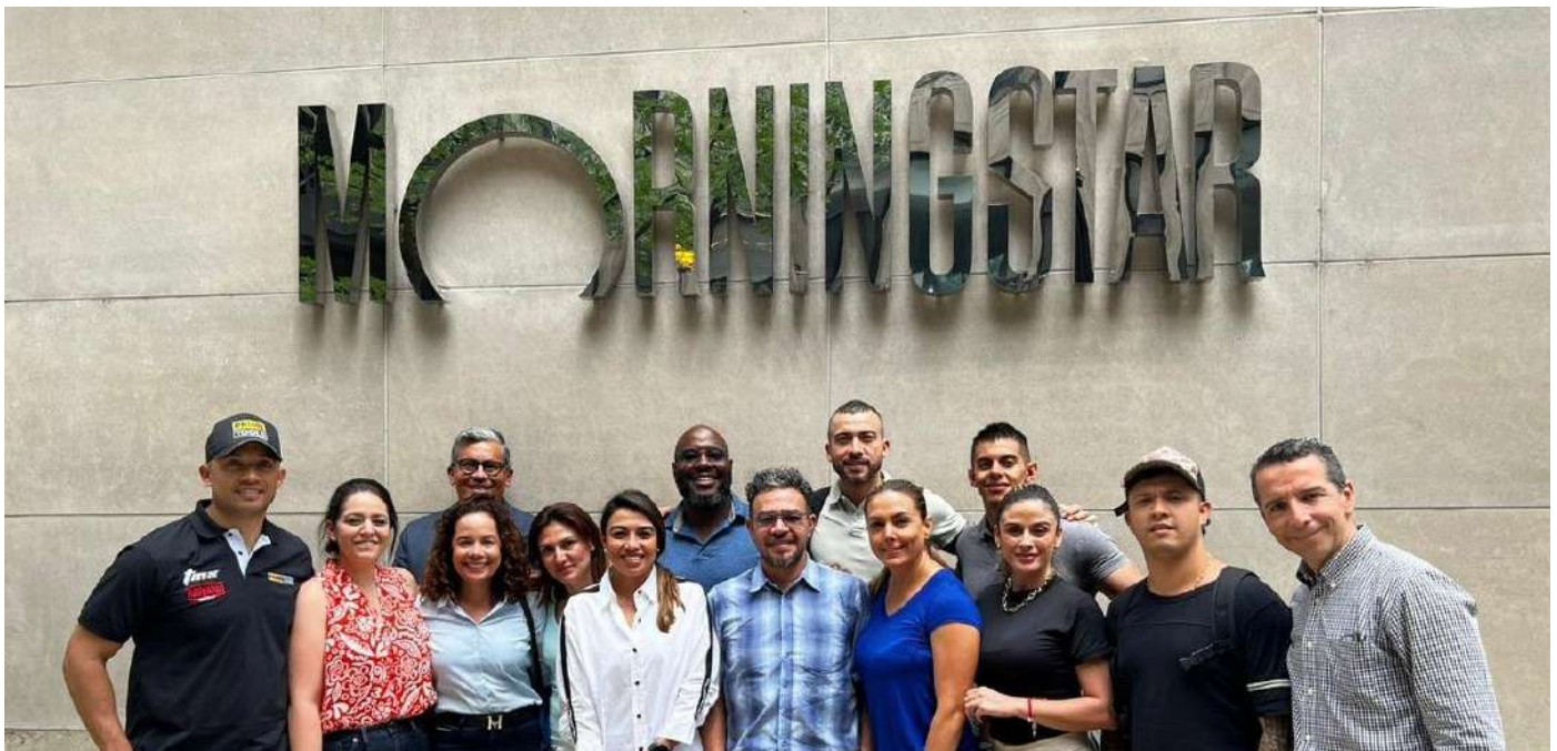
Illinois Institute of Technology CHICAGO, ESTADOS UNIDOS