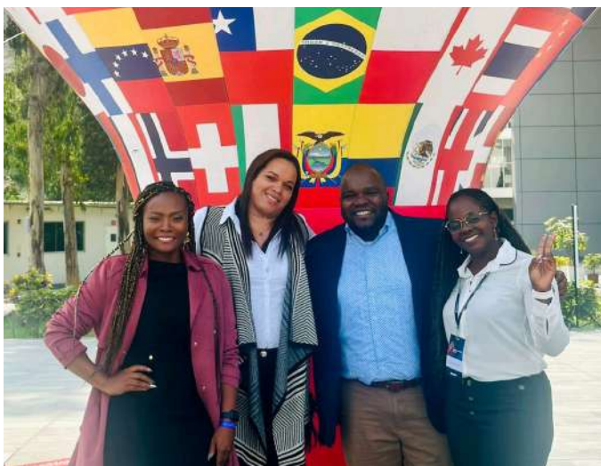
ESAN LIMA, PERÚ

Este curso internacional, además del objetivo en términos de conocimiento, tiene la finalidad de ofrecer un contacto directo con la cultura de otro país, ampliar la perspectiva y facilitar la identificación de oportunidades globales.