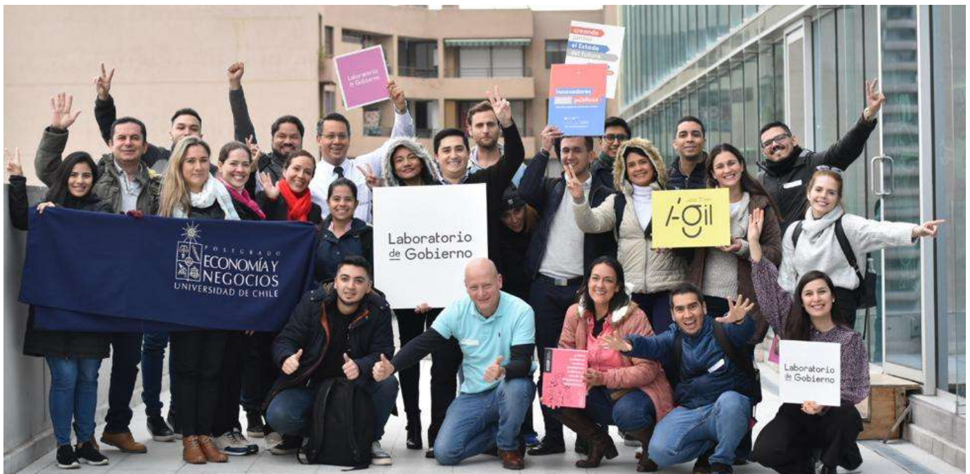
Universidad De Chile SANTIAGO DE CHILE, CHILE