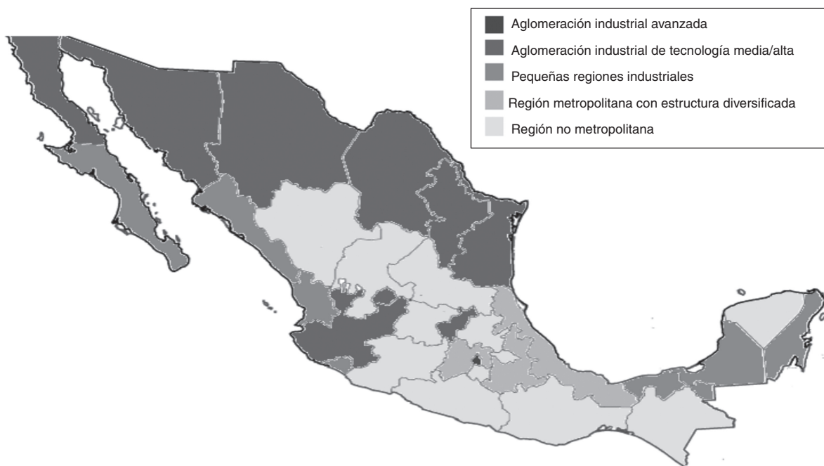
Figura 2. Agrupaciones regionales de innovación en México.

en ella se realiza gran parte de la actividad industrial de maquila que requiere la capital y no dedica esfuerzos a la innovación, puesto que se sirve del desarrollo en innovación de la Ciudad de México.