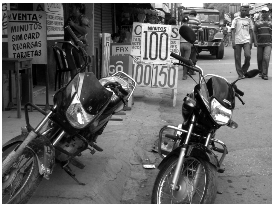
Foto 1: minutos a 100, mototaxis a 1000. El Carmen de Bolívar, Colombia.

De este modo, en la cuadra del mercado en El Carmen de Bolívar se puede comprar un minuto de llamada a cualquier celular del país por 100 pesos; una carrera en mototaxi a cualquier casa del pueblo por 1000 pesos; y un galón de agua potable en bolsitas por 2000 pesos. Es la economía informal de la pobreza.