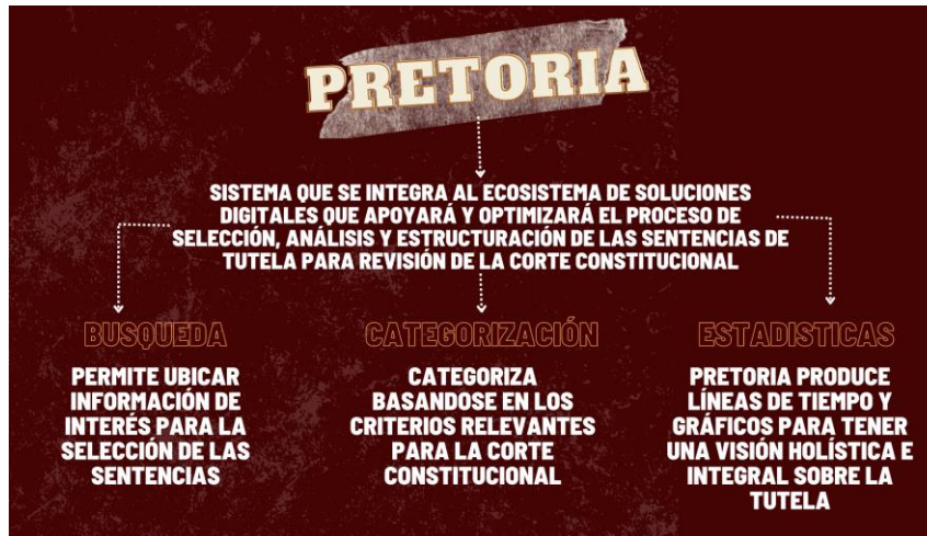
Figure 1. Estructura general del software Pretoria