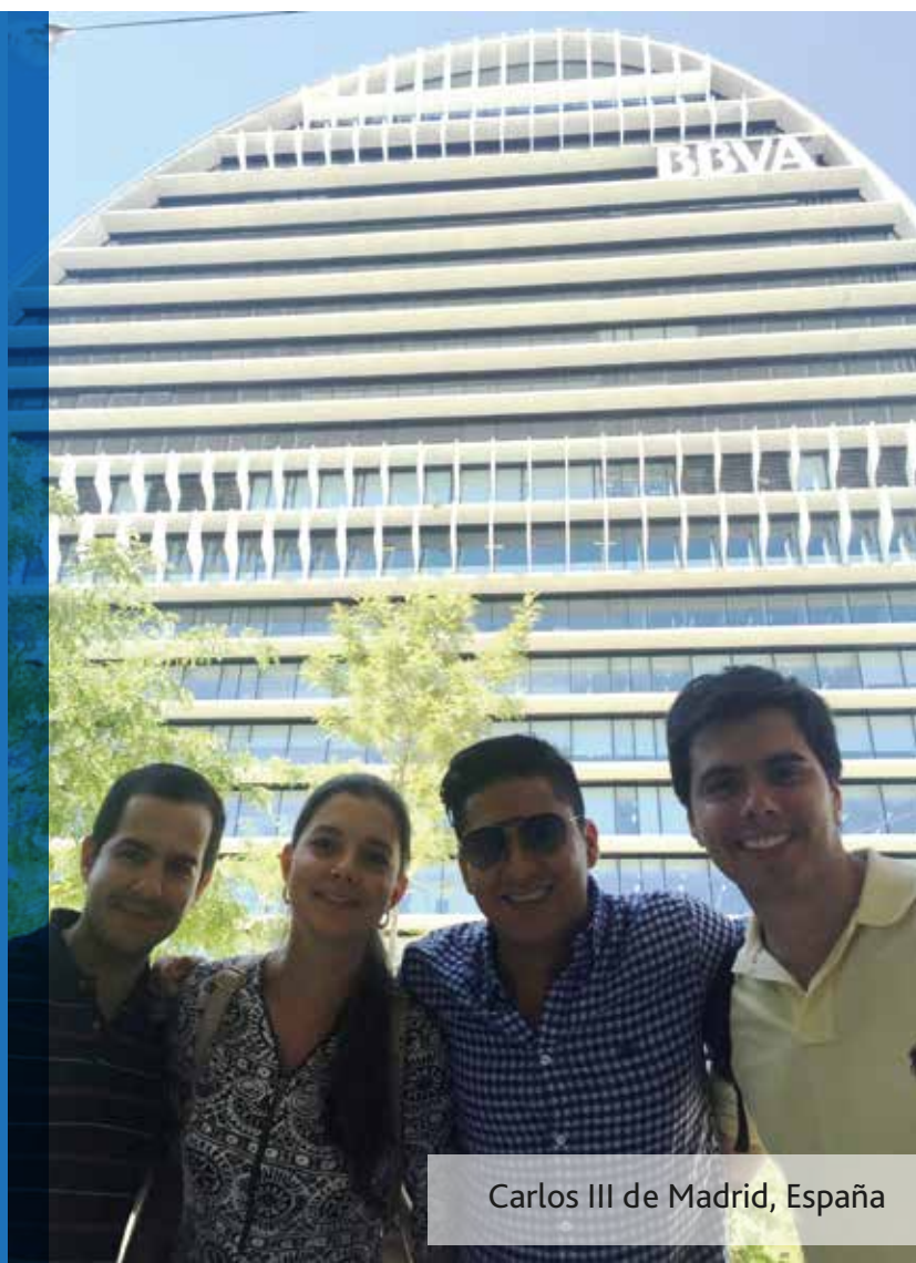
Carlos III de Madrid, España

Este curso internacional, además del objetivo en términos de conocimiento, tiene la finalidad de ofrecer un contacto directo con la cultura de otro país, ampliar la perspectiva internacional y facilitar la identificación de oportunidades globales.