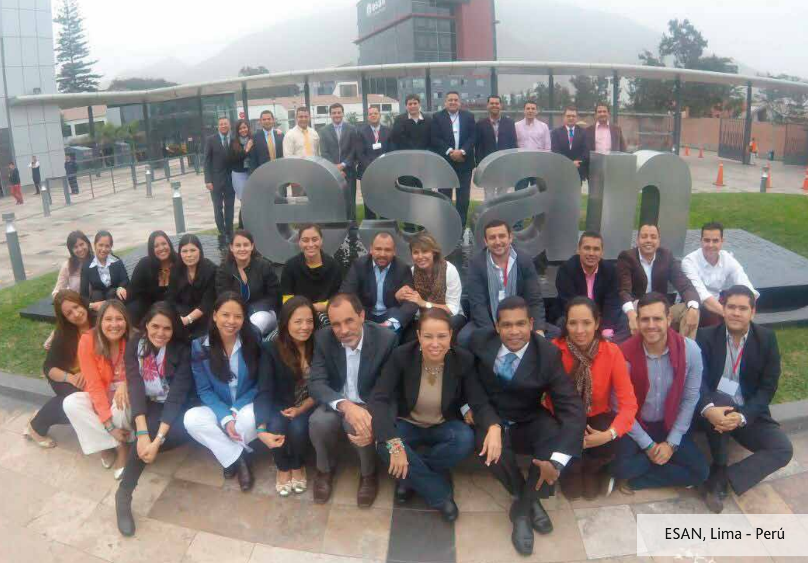
ESAN, Lima - Perú