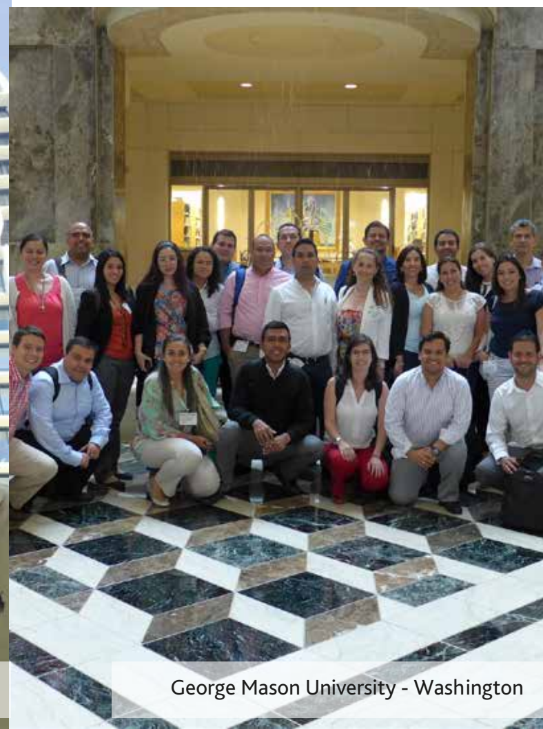
George Mason University - Washington