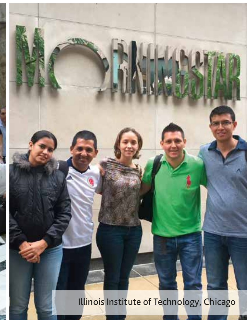
Illinois Institute of Technology, Chicago