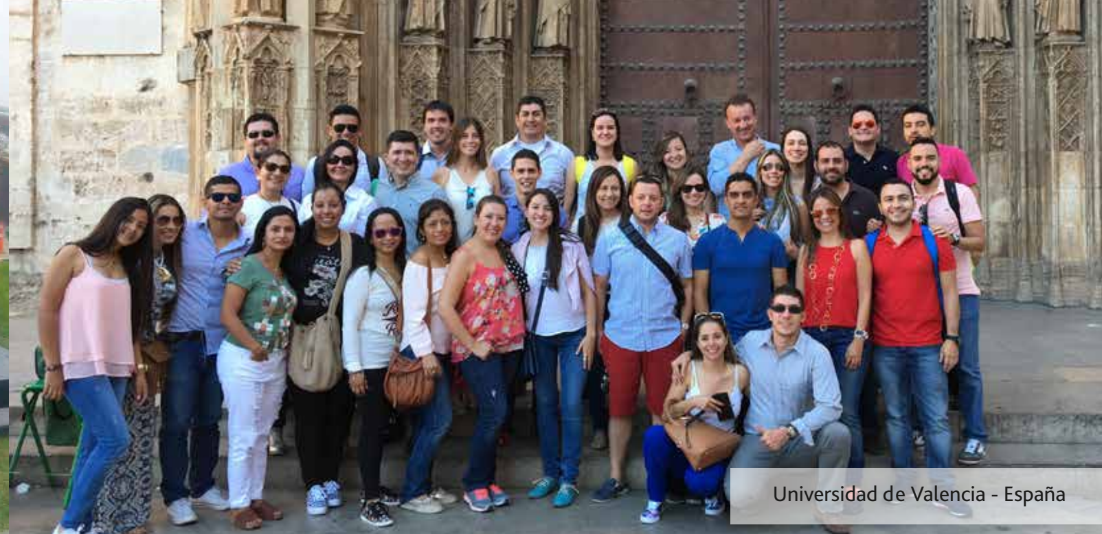
Universidad de Valencia - España

En el año 2016, participaron 155 estudiantes en los cursos internacionales. Hacia España, viajaron 33 estudiantes para la Universidad de Valencia y 31 para la Universidad Carlos III de Madrid. En Perú, 40 estudiantes participaron de la Semana Internacional de la ESAN, y en Estados Unidos, 21 estudiantes asistieron al curso en el Illinois Institute of Technology y 30 en la George Mason University.