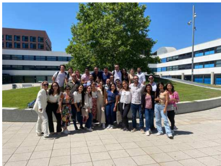
Tecnocampus BARCELONA, ESPAÑA