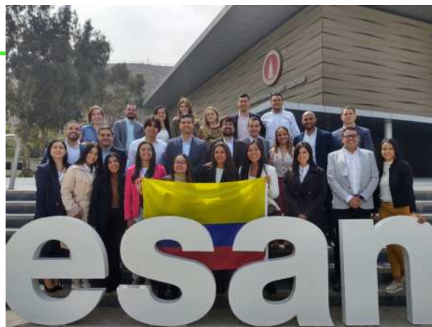
ESAN LIMA, PERÚ