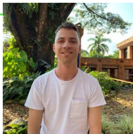
SEMESTRE DE INTERCAMBIO Toulouse Business School, Francia Maestría en Mercadeo