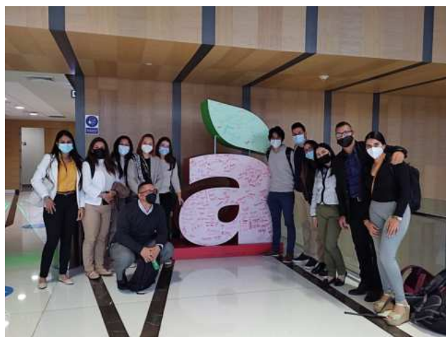
ESAN LIMA, PERÚ