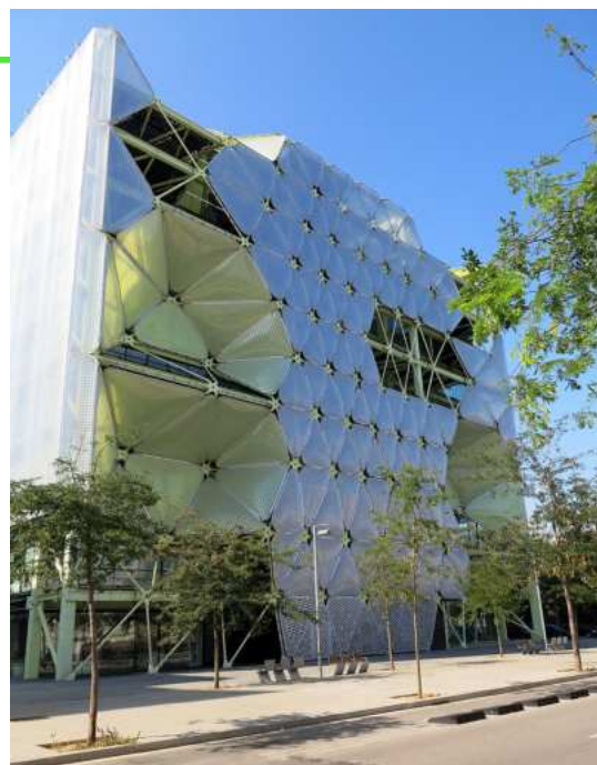
MediaTIC Barcelona BARCELONA, ESPAÑA