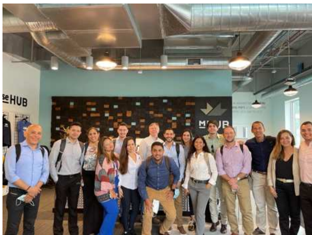
Illinois Institute of Technology CHICAGO, ESTADOS UNIDOS

Este curso internacional, además del objetivo en términos de conocimiento, tiene la finalidad de ofrecer un contacto directo con la cultura de otro país, ampliar la perspectiva y facilitar la identificación de oportunidades globales.