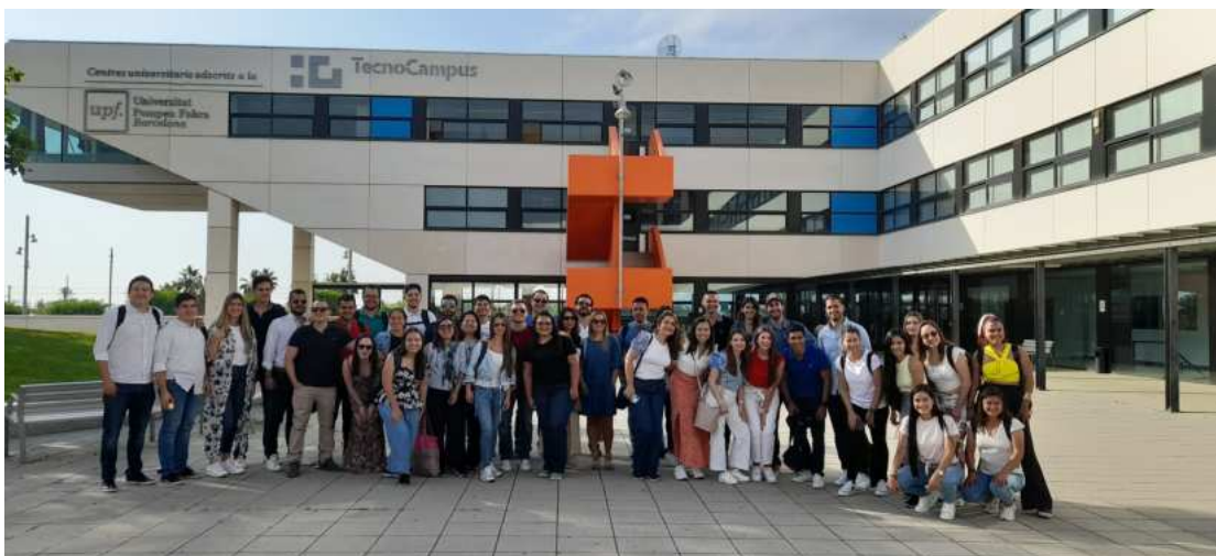
Tecnocampus BARCELONA, ESPAÑA