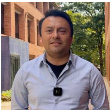
ESTUDIANTE MBA Concepción, Chile

El seminario ha sido bastante bueno y bastante intenso, pero permite poner en práctica todas las habilidades y conocimientos que nosotros hemos adquiridos durante el programa completo del Magíster. Siento que me va a servir bastante en el desarrollo y el futuro de mi carrera profesional, igual me ha permitido ver diferentes áreas, cómo se pueden comportar y cuáles son los aspectos que cada uno tenemos que mejorar para poder desarrollar esta área y cómo también nuestras decisiones pueden impactar en diferentes mercados.