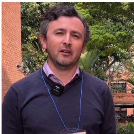
ESTUDIANTE MBA Concepción, Chile

En este seminario la verdad me he sentido muy gratamente sorprendido. De igual manera, hemos encontrado un equipo docente de alta calidad con unos coaches que han tenido con nosotros una deferencia particular; nos han entregado su feedback muy constructivo y las herramientas que estamos aplicando acá que para mí son muy novedosas.