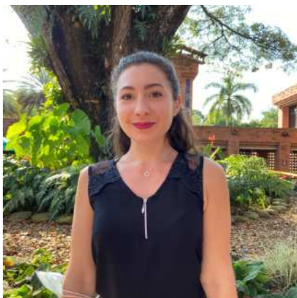
SEMESTRE DE INTERCAMBIO Skema Business School, Francia Maestría en Mercadeo

La educación y las clases fueron de alta calidad, con profesores “apasionados” e interesantes con oportunidades para practicar muchas actividades artísticas, deportivas o culturales. La Maestría en Mercadeo, con su formato híbrido (en línea y presencial), me parece bien construida y completa, además que te da la posibilidad de viajar mucho por todo Colombia, lo que me llenó de alegría. Es un país maravilloso, con una población muy amable, con una comida riquísima, con estilos musicales variados, con paisajes suntuosos.