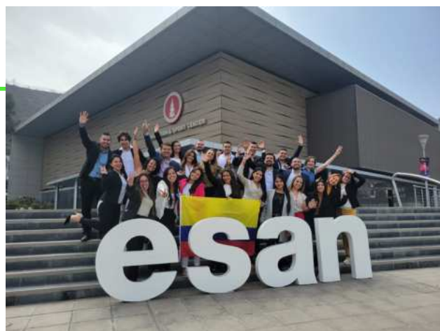
ESAN LIMA, PERÚ